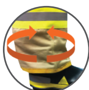
Elástico en pantalones y tobillos