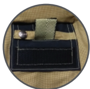
DRD NFPA 2013